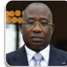
2 ÈME VICE-PRÉSIDENT: Le Ministre chargé des Affaires Etrangères ;