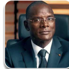
1 ER VICE-PRÉSIDENT: Le Ministre chargé de l'Administration du Territoire et de la Décentralisation ;