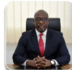
RAPPORTEUR: Le Secrétaire Exécutif

26 membres issus des ministères et structures techniques nommés par arrêté n° 446/ PMMBPE/ CAB du Premier Ministre en date du 25 juillet 2018.